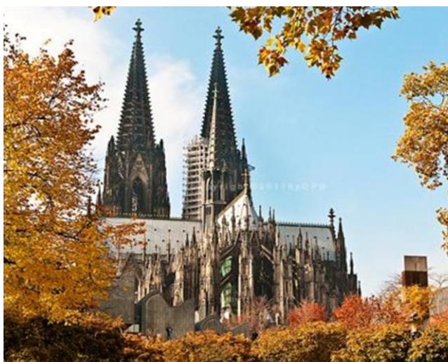
Domkirken i Köln

Afg. kl. 08.30. Der er kaffepause undervejs, og vi kører til byen Köln, for at se den verdensberømte domkirke. Der har været kirke her siden år 300, men først langt senere, efter en brand, påbegyndte man opførelsen af verdens måske mest pompøse kirkebyggeri. For at anskueliggøre omfanget af det enorme bygningsværk, som det tog hundrede af år at færdiggøre, kan vi nævne, at kirkens bebyggede areal er flere hektar stort, 167 meter højt og 144 meter langt (Rundetårn er 33 meter højt). Her i domkirken opbevares resterne af de Hellige 3 konger, som besøgte Jesusbarnet i stalden i Betlehem, hvor han blev født.