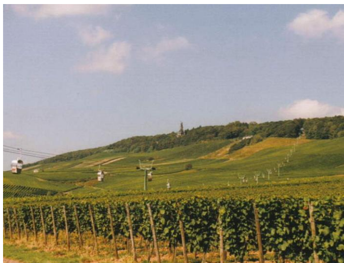
Svævebanegondoler på vej over vinmarkerne

Vi når frem til udsigtspunktet "Nieder Wald Denkmal", hvorfra endnu en smuk udsigt må fordøjjes. Herfra skal vi til den kendte vinby Rudesheim, og for at komme i den rigtige stemning, så skal vi med en kabine-lift svæve nedover vinmarkerne til byen (alle kan deltage). I Rudesheim kan man slentre en tur gennem "Drosselgasse" og fornemme den gemytlige stemning, som denne berømte gade er kendt for. Efter et ophold her, skal vi gæste et ikke helt almindeligt sted. Vi skal besøge toppen af tysk vinproduktion, stedet hvor hvidvinen blev udviklet og forædlet for flere hundrede år siden. Vinslottet hedder Johannisberg, og regnes for et "Mekka" i produktionen af hvidvin.