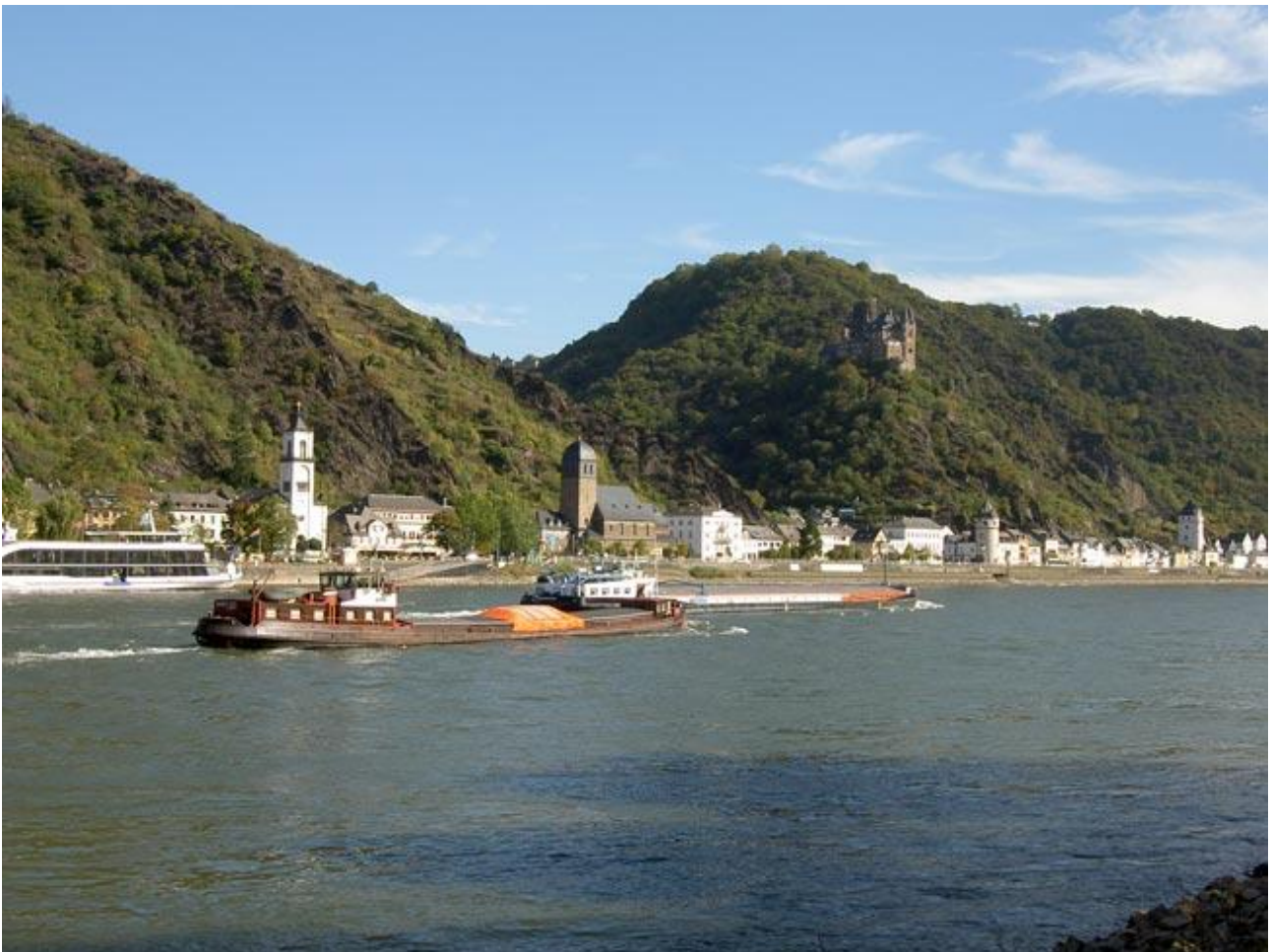
"Travlhed på Rhinen"

Afrejse: 17. juni / Hjemkomst: 24. juni 2012